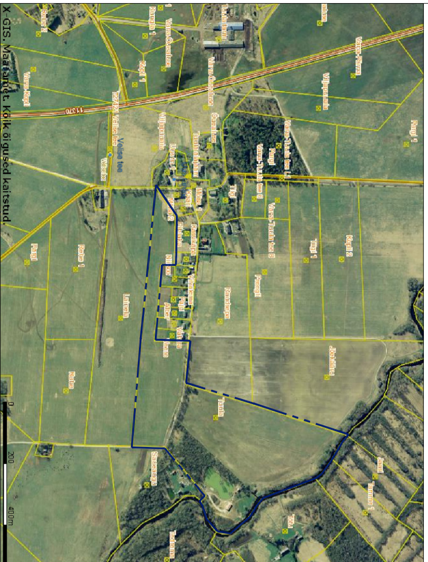
ASENDISKEEM TERVE TUULA MAÄJKUSE KRUNDIPIIRI ULATUSES